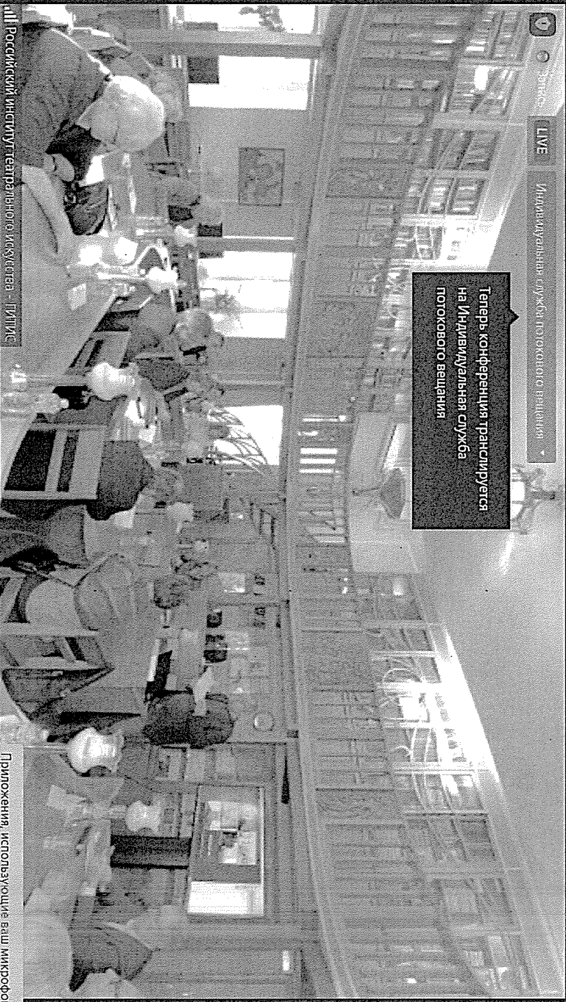
Российский институт тестирования - ТИТИС

Теперь конференция транслируется на Индивидуальная служба потокового вещания